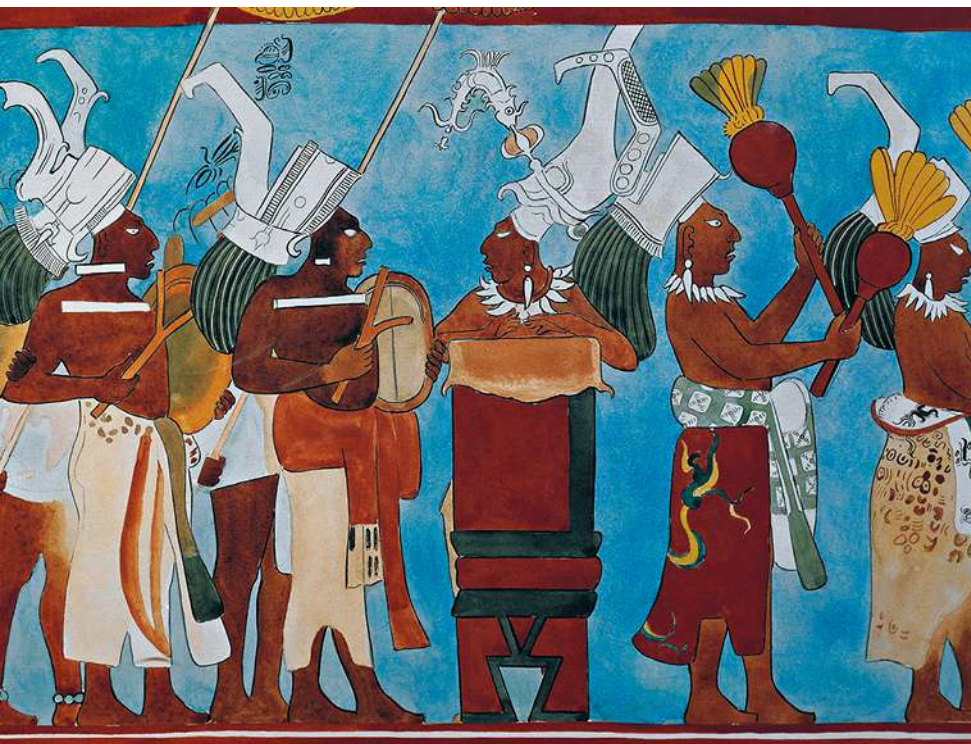
Fresco van Maya-muzikanten uit de 9 e eeuw.